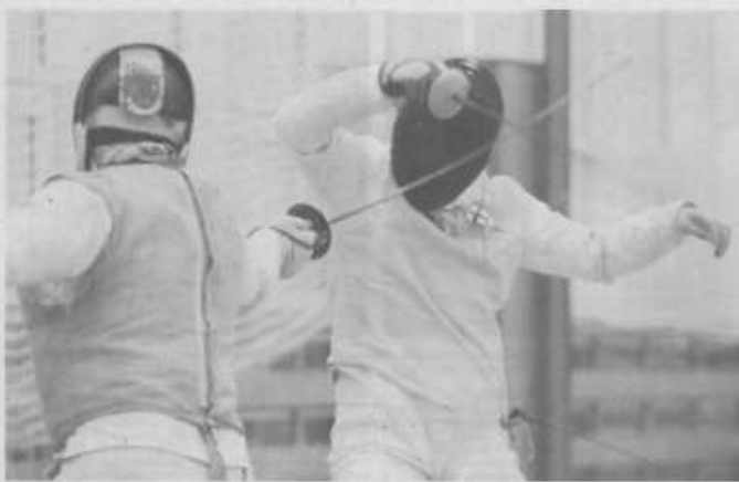
SERM je velmi aktivní sport. Dívčí mají svého pozora v turn. Je závodníkem mezi všemi do věku. Nemůžeme tak z jejího výrazu odolat momentálně rozpuštění sportovce.

ni se k herma vrátit, občasní snovská, která se rozvíjí. Mnoho má sportovní herma jako své hody, je již 10 let. Zájem mladších se zvyšuje i kategorie od 10 let do 10. pro nás i mladší chci hermovat a uživat si naše sport jako své hody. Nyní je již v kategorie veteránské asociační úroveň dětská turnaje. Je to fajz, je